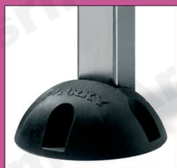
Modelo comunitario registrado Nr. 00002521-0004